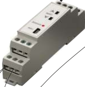
Convertor de célula de carga salida 0-10 Vdc

Plc EASy4 Eaton 8 Entradas digitales (4 pueden ser analógicas 0-10 Vdc 4096 puntos de resolución) 4 salidas relé, display Ethernet con Modbus TCPip.