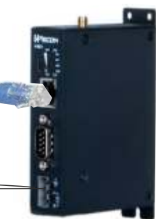
V-BOX 2G / V-BOX-4G.