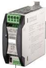
Fuente de alimentación 24 Vdc 2,5 A.